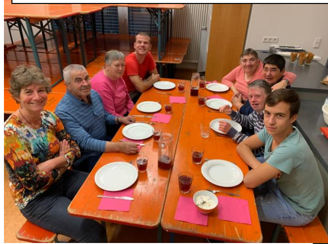
Die Raben warten auf die überbackenen Seelen