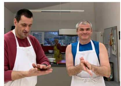
Das Ergebnis lässt sich sehen und schmeckt lecker