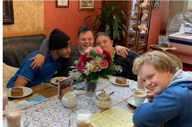
Die Wölfe müssen sich vom vielen Ausprobieren der Traktoren und Bagger erholen