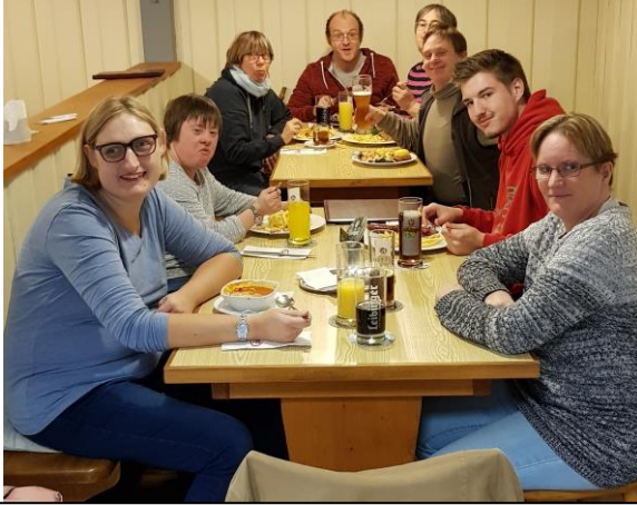
Die Ameisen waren beim Kegeln