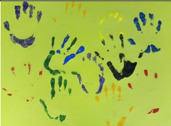
die Ameisen sind herbstlich kreativ, hier das Ergebnis