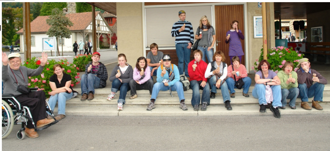
Bild rechts: Eis essen in Stein am Rhein Bild oben: Boot fahren auf dem See

Traumhaftes Wetter, super Stimmung, tolle Leute, ein Ausflug zu den Rheinfällen, ein Stadtbummel durch die Altstadt von Stein am Rhein, mit Ruderbooten über den Bodensee schippern, eine Nachtwanderung, gemeinsam spielen und singen und auch noch super Essen. Das war das Wochenende auf der Höri auf dem man wirklich nix vermissen konnte.